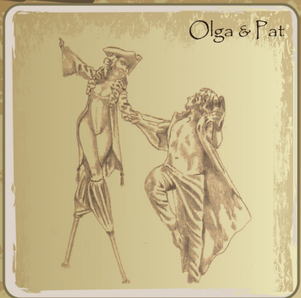
Olga & Pat